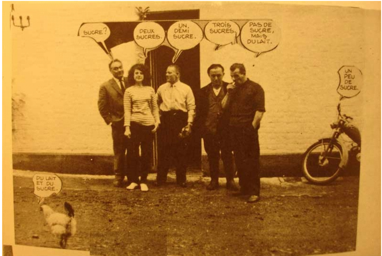
Μεταστροφή σε φωτογραφία των μερικών καταστασιακών