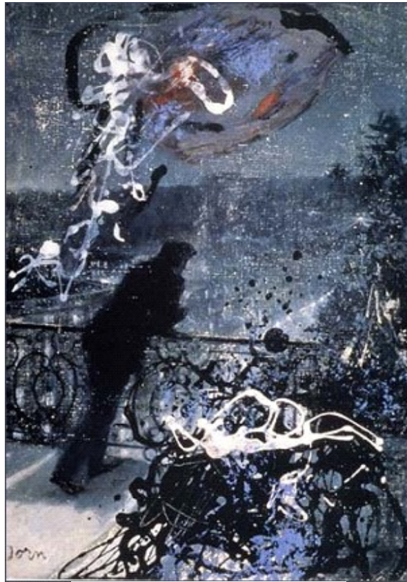
Asger Jorn, Paris at night, 1959

αφού η αξία ενός έργου εξαρτάται από την δημιουργικότητα και τους συνειρμούς του παρατηρητή. Μόνο μία ζωντανή τέχνη είναι ικανή να ενεργοποιήσει τη δημιουργικότητα.