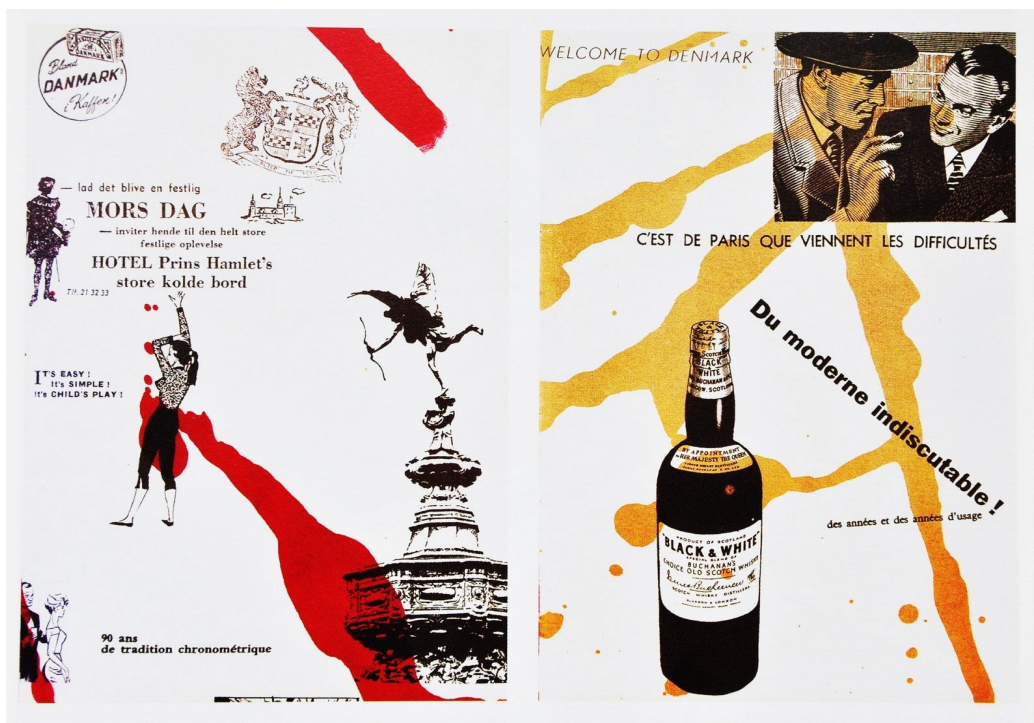
Guy Debord - Asger Jorn, To Τέλος της Κοπεγχάγης , 1957

Ο Άσγκερ Γιρν, μέλος της Cobra, ζωγράφος και γλύπτης, συνεργάστηκε με τον ΝτεΜπόρ για το βιβλίο “Το Τέλος της Κοπεγχάγης” χαρακτηριστικό δείγμα χρήσης της μεταστροφής του κόμικ αλλά και της διαφήμισης.