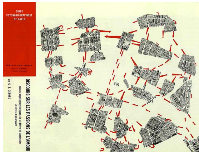
Guy Debord, "Psychogeographic guide of Paris", 1955