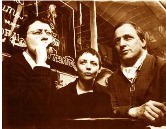
Οι Guy Debord, Michelle Bernstein και Asger Jorn στο Παρίσι το 1961

Στο ξεκίνημα της η Καταστασιακή Διεθνής απαρτιζόταν από καλλιτέχνες που προέρχονταν από την μεταπολεμική ευρωπαϊκή πρωτοπορία όπως η ομάδα Cobra και οι Λεττριστές, μια ομάδα πρωτοποριακών καλλιτεχνών με σουρρελιστική παράδοση, που κι αυτοί είχαν επηρεαστεί από παλαιότερα ρεύματα των αρχών του 20ού αιώνα (Νταντά, υπερρεαλιστές, φουτουριστές κλπ). Η Καταστασιακή Διεθνής ιδρύθηκε στις 28 Ιουλίου του 1957 στο Cosio d'Arroschia της Ιταλίας υπό την συγχώνευση τριών ομάδων, του «Κινήματος για ένα φαντασιακό Μπάουχάους» (γαλ. «Mouvement pour un Bauhaus Imaginiste») που είχε ιδρύσει ο ζωγράφος Asger Jorn, της «Ψυχογεωγραφικής Εταιρείας του Λονδίνου» που είχε ιδρύσει ο Ράλφ Ράμνεϊ και των Λεττριστών. Πρωταγωνιστής ήταν ο Γκυ Ντεμπόρ, ο οποίος έθεσε τα θεωρητικά θεμέλια της ομάδας. Ανάμεσά τους ήταν και οι Ατίλα Κοτάνι, Ζακλίν ντε Γιόνγκ, Χανς Πλάτσεκ, Ιβάν Στσέγκλωφ, Ραούλ Βανέϊγκεμ, Αλεξάντερ Τρόκι, Ούβε Λάουσεν, Μισέλ Μπέρνσταϊν, Μουσταφά Χαγιατί, Αμπντελχαφίντ Χατίμπ, Ρενέ Βιενέ, Γκρέτελ Σάντλερ και ο Ντίτερ Κούνζελμαν της Kommune1.