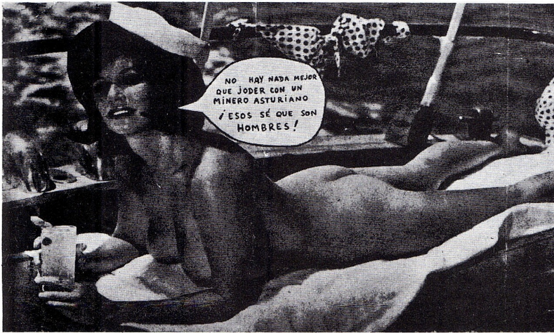
I can't think of anything better than sleeping with an Asturian miner. They're real men!