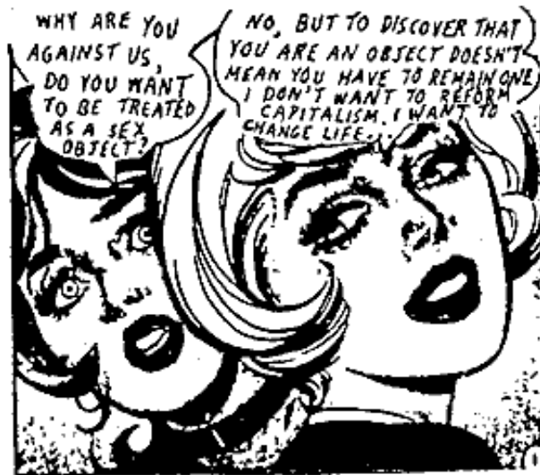
U.S. Situationist graphic, circa 1960's -Anonymous.

Παρακάτω θα γίνει μια σύντομη παρουσίαση του κινήματος και των εκφραστών του, της άποψης τους για την τέχνη και τη χρήση της μεταστροφής σε όλες της τις εκφάνσεις.